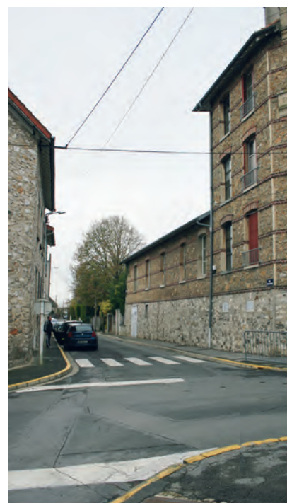
Rue Denfert Rochereau