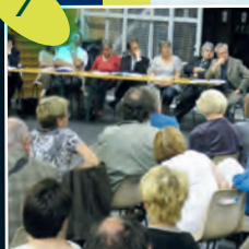
Réunion de riverain