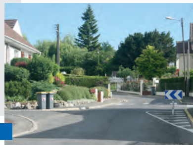
Rue Arthur Boucher