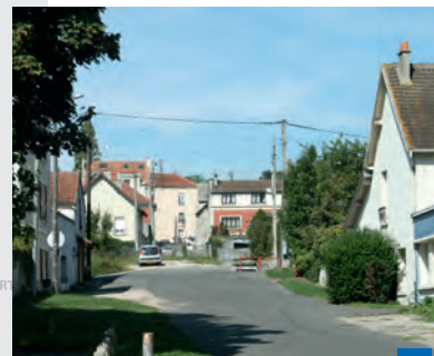
Rue de l'abreuvoir