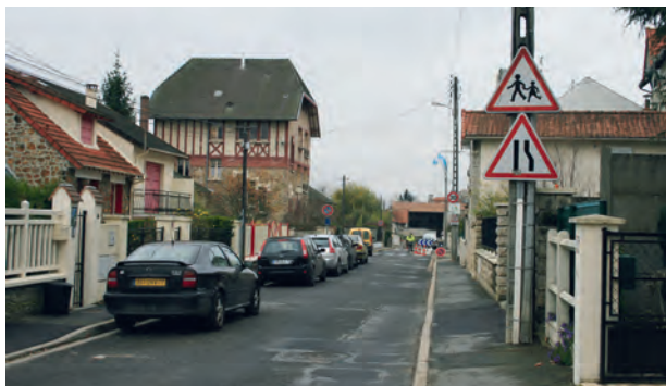
Rue Emile Blanchet