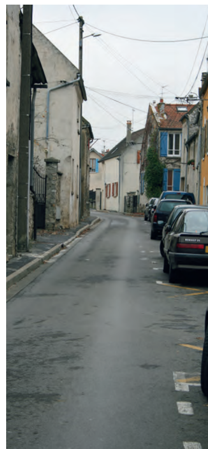
Rue Antoine Labour