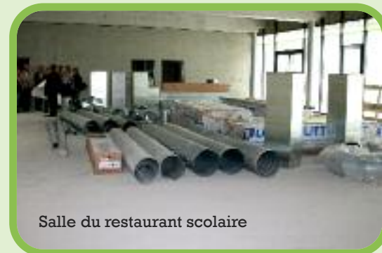
Salle du restaurant scolaire

Comme chaque année, plusieurs projets devraient voir le jour, cet été.